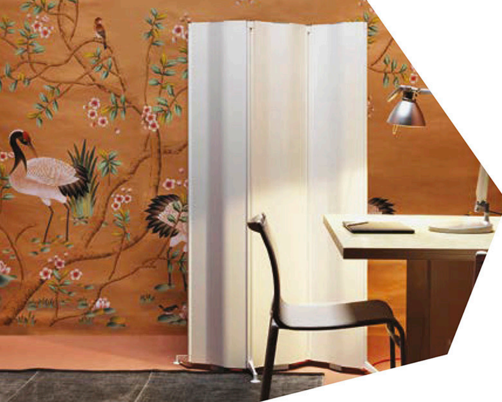
Zwillinge: Tubes Origami